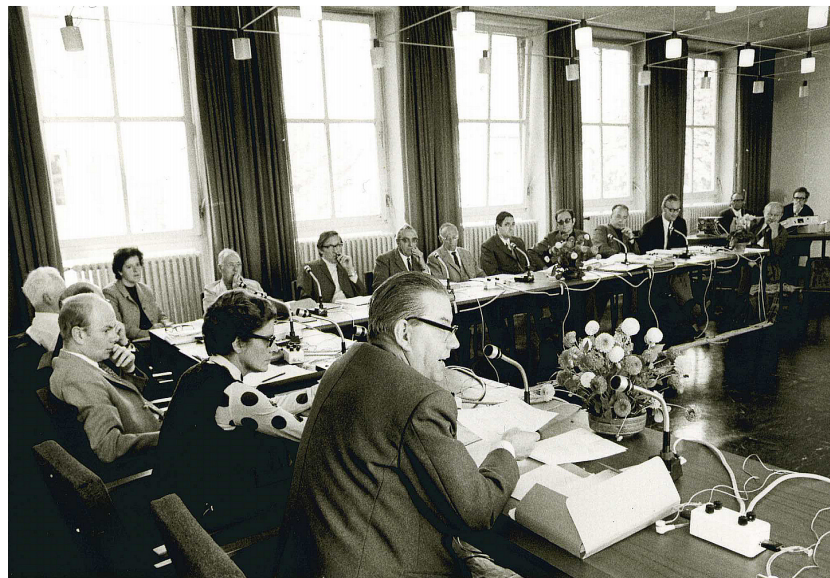
Georg Eckert auf der Arbeitstagung zur Darstellung von Religions- und Kirchengeschichte, 1971

gemeinsam – und sehr erfolgreich – daran, Feindbilder, Stereotype und einseitige Darstellungen zu identifizieren und auf eine entsprechende Revision der Schulbücher hinzuwirken: 1951 konstituierte sich die deutsch-französische Schulbuchkommission, ohne deren langjährige Arbeit das 2006 erschienene, deutsch-französische Geschichtsbuch nicht denkbar gewesen wäre. Auch die 1972 gegründete Gemeinsame Deutsch-Polnische Schulbuchkommission leistete einen Beitrag zur Verständigung. Gegenwärtig arbeitet die Kommission zusammen mit dem Georg-Eckert-Institut an einem gemeinsamen deutsch-polnischen Geschichtsbuch.